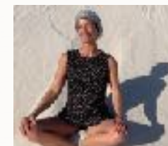
Deine UREIGENE KRAFT aktivieren und pflegen

Vielleicht wirst Du dann spüren wie Du mit mehr SCHUTZ-STABILITÄT- KLARHEIT- FREUDE- BEGEISTERUNG und KRAFT dem Alltag begegnest.