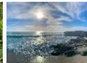
Auf „innere Abenteuerreise“ gehen !