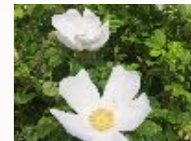
AUFTANKEN UND ERBLÜHEN LASSEN

Wie ein Auto manchmal in die Werkstatt gebracht wird, kannst Du hier Deinen Körper „energetisch überprüfen lassen“ und Kraftstoff tanken.