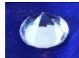
Die ESSENZ in Dir sichtbar werden lassen ....

Kursdaten im 2022 : 15.01/ 12.03/ 7.5/ 2.7 (Anmeldefrist: 15.Dez. 2021)