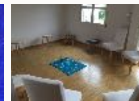
.... und gemeinsam in SCHWINGUNG bringen !