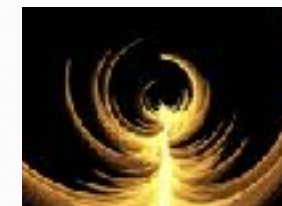
ZU DIR FINDEN .... :-)